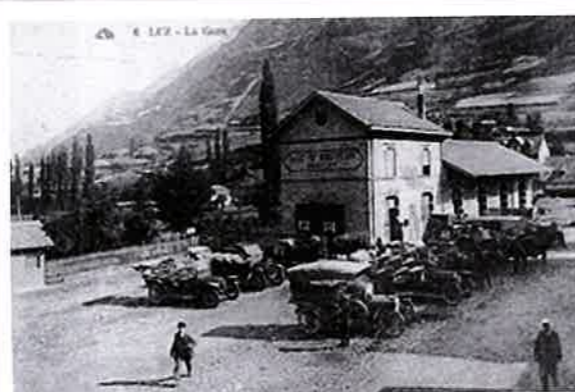
Gare à Esquize-Sère