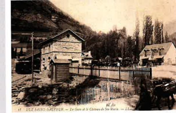
La gare de Luz St Sauveur à Esquize-Sère

A l'arrivée, les correspondances par calèches et voitures puis par autocars, étaient assurées pour Saint-Sauveur, Barèges et Gavarnie.