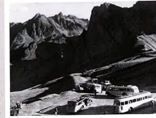
Col du Tourmalet

En 1932, le développement de l'automobile porta un coup fatal à la ligne de tramway.