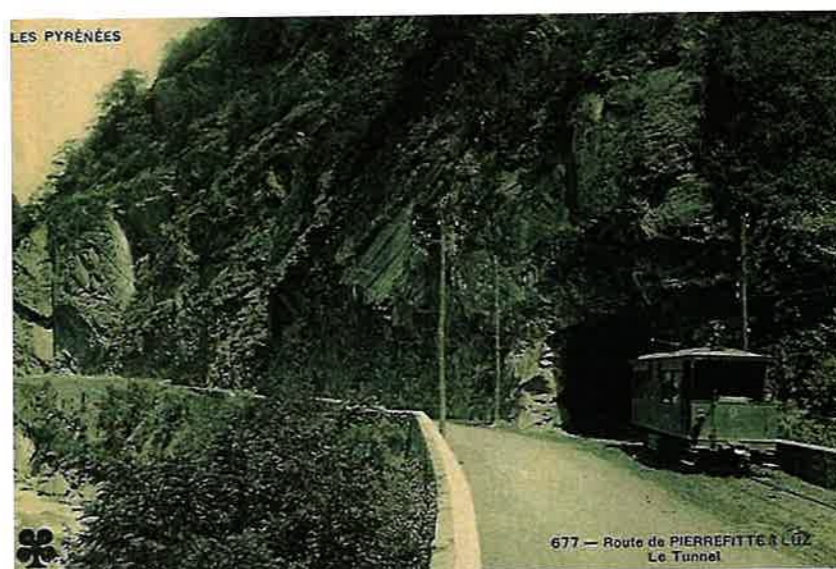
Le tramway dans les gorges au pont d'Enfer

Vauban, envoyé sur les lieux par Louis XIV à l'occasion de l'arrivée aux bains de Barèges en 1675 de son fils Monseigneur le Duc de Maine qui souffrait d'une infirmité et de Madame de Maintenon qui l'accompagnait, trouva les escarpements de ce sentier trop difficiles et les aménagements très coûteux. C'est en 1733 que Colbert fit entreprendre des travaux et la première voiture attelée arriva à Luz-St-Sauveur par ce sentier en 1744.