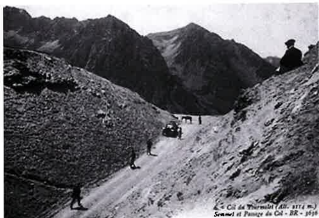
Col du Tourmalet

L'ÉTÉ, PÉRIODE PROPICE POUR « PRENDRE LES EAUX » À BARÈGES, L'ACCÈS AU PAYS TOY SE FIT LONGTEMPS PAR LE COL DU TOURMALET.