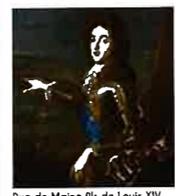
Duc de Maine fils de Louis XIV

Il existait bien un petit sentier depuis Pierrefitte mais il n'était pas carrossable.