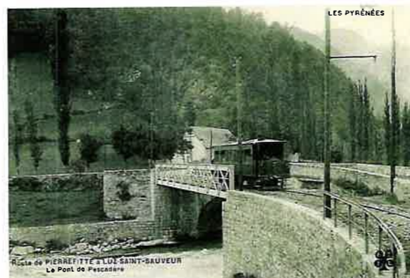
Traversée du pont de Pescadère à l'entrée d'Esquize-Sère

La ligne de Luz n'a jamais connu le succès de celle de Cauterets. Dès 1932, les services voyageurs jusqu'à Barèges et Gavarnie sont reportés sur autocars et la ligne est abandonnée. La ligne de Cauterets subit elle aussi la concurrence de la route et cesse son activité en avril 1949.